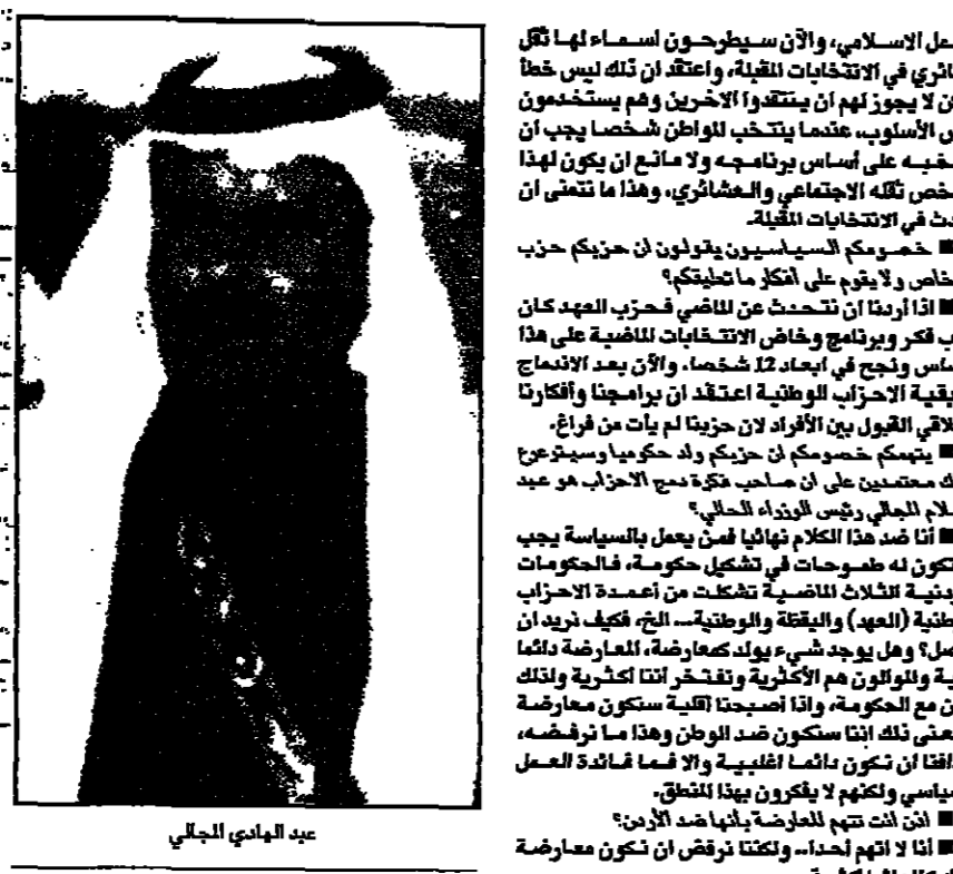
عبد الهادي المجالي

خلال امين عام الحزب الوطني المستوري عبد الهادي المجالي ان الصراع بين الاحزاب يجب ان يكون على البرامج وليس على الشخصيات دون ان يفتي برحمة للانتخابات لاسماء شخصيات تركت الى قتل المشاطي، ولكه ولا حزمه للحكومة رسميه ان يكون دوما كذا. وقال المجالي في حديث مع «القدس العربي» ان من حق الأردني ان يبحث مخرج للاجئين الفلسطينيين بسبب القامة كسب كبير منهم على ارضيه داهية المستحيل ايجادها الا بالاعتماد على القوة الغربية، كما ان تعديل مادة الدستور الأردني التي تقول ان سكان الضفة الغربية ليسوا مواطنين في الحقوق والواجبات من سكان الضفة الغربية. وقال المجالي في حديث مع «القدس العربي» ان من حق الأردني ان يبحث مخرج للاجئين الفلسطينيين بسبب القامة كسب كبير منهم على ارضيه داهية المستحيل ايجادها الا بالاعتماد على القوة الغربية، كما ان تعديل مادة الدستور الأردني التي تقول ان سكان الضفة الغربية ليسوا مواطنين في الحقوق والواجبات من سكان الضفة الغربية.